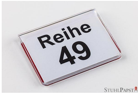
Reihennummerierung zum aufkleben